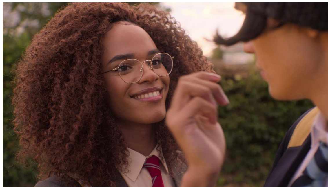
Elle Argent incarnée par Yasmin Finney - Heartstopper