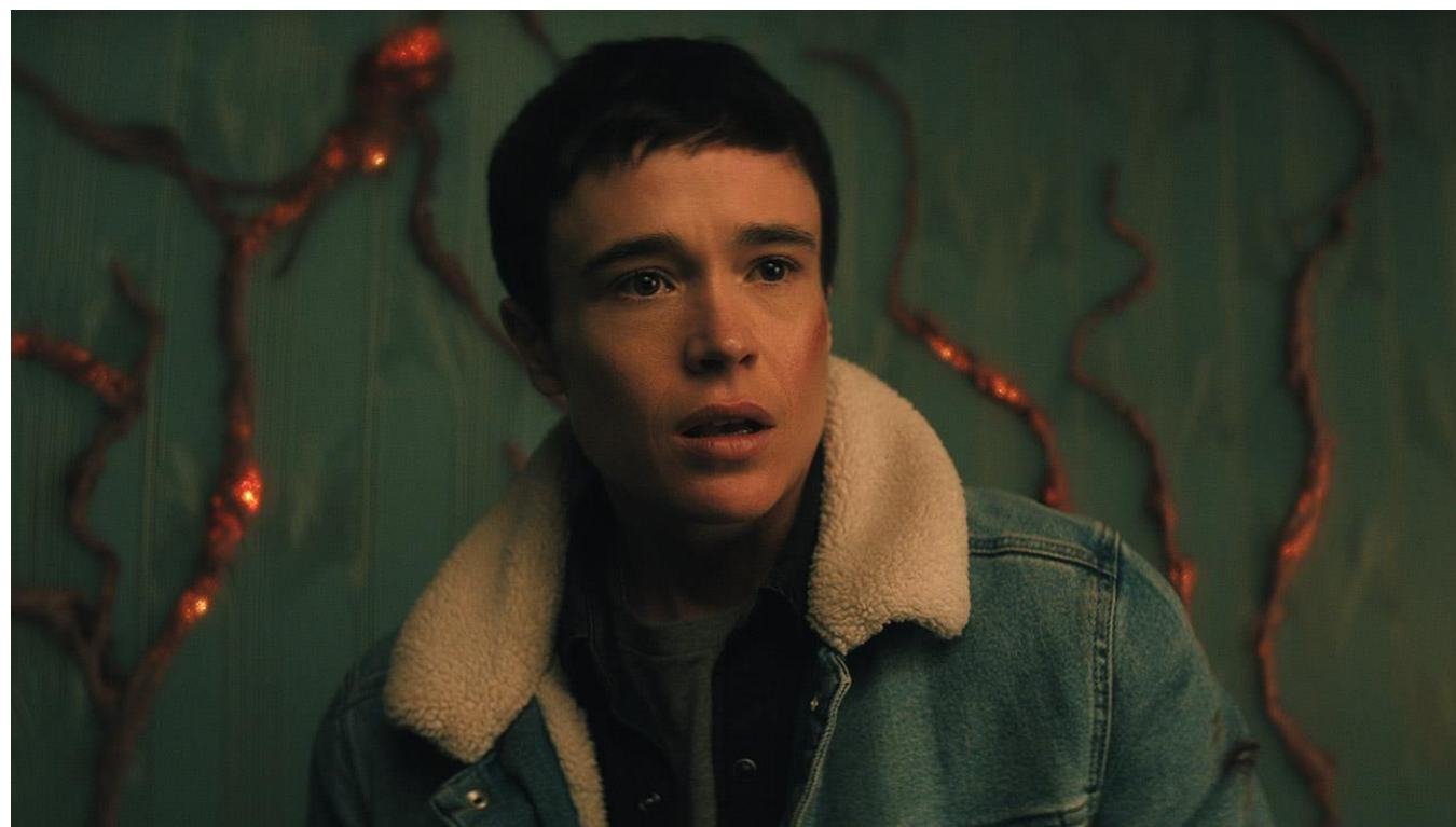
Viktor Hargreeves incarné par Elliot Page – Umbrella Academy